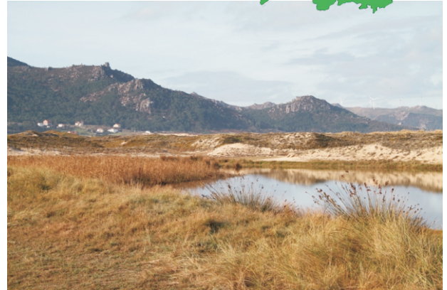
A praia de Traba, de 2.630 m de lonxitude conserva un amplo cordón de dunas fixadas pola vexetación.