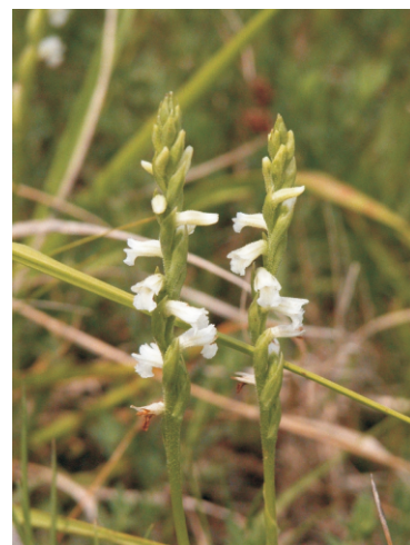
Spiranthes aestivalis , orquídea de pequenas flores dispostas en espiral arredor do talo que podemos atopar perto das lagoas da costa da morte