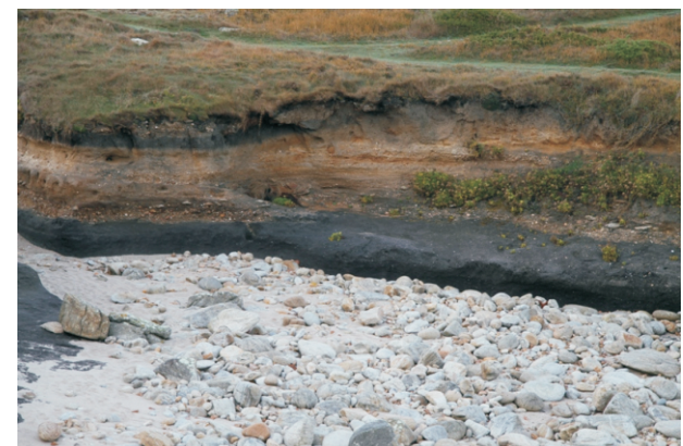
Praia de Castrallón, de gran interese xeolóxico