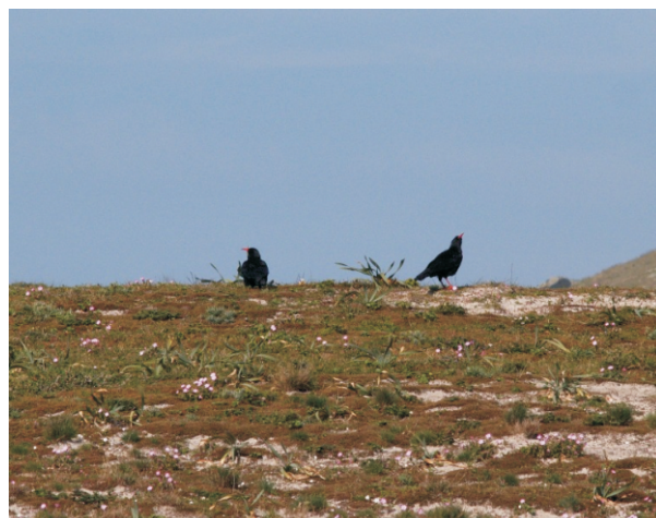
Chouas nas dunas de Soesto, un dos poucos lugares costeiros de Galicia onde se poden ver.