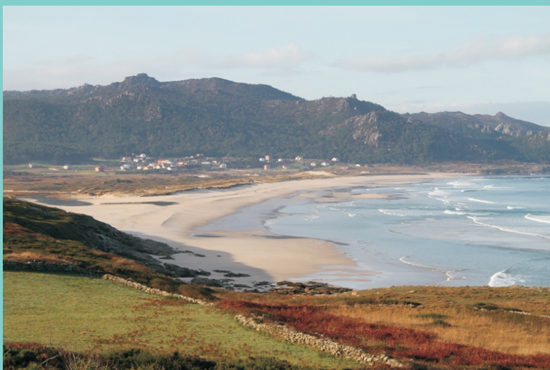
Vista da praia de Traba desde a punta de Arnao. Ao fondo Pena Forcada.