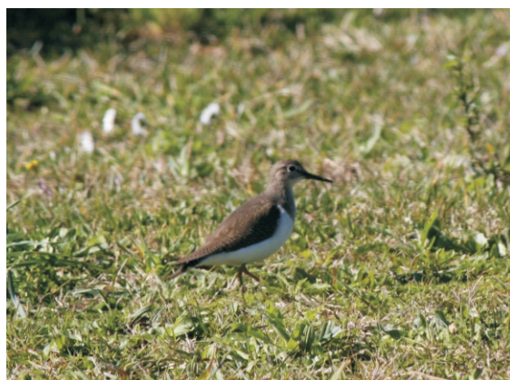
Bilurico bailón ( Actitis hypoleucos ), pequena limícola invernante e de paso en Galicia.