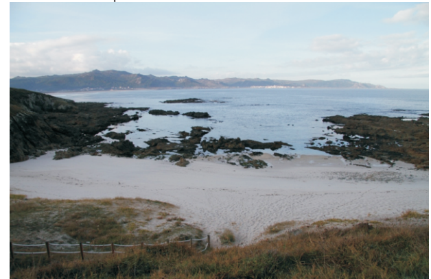
Praia de Arnado